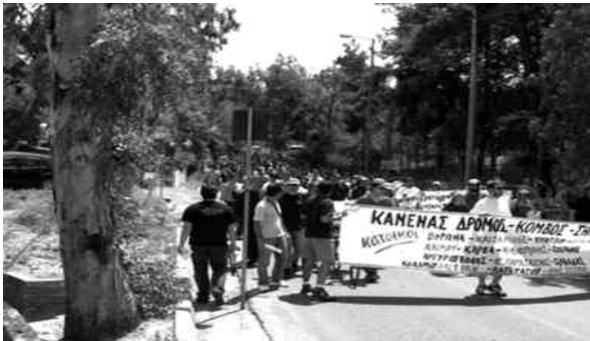
Αφιέρωμα στα κινήματα πόλης